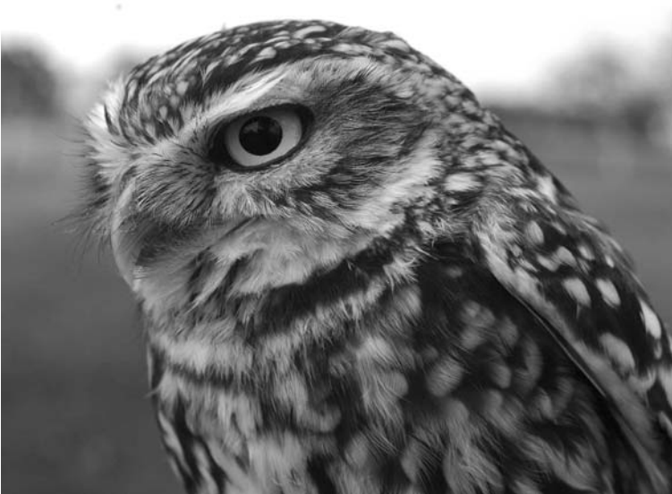
Steinkauz, Hassel, April 2005